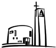
Kostel Svatého Ducha v Ostravě-Zábřehu s relikviemi Jana Pavla II.